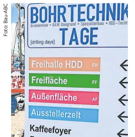
Ein breites Tagungs- und Eventprogramm locken ins Bau-ABC Rostrup.

überblick mit Erfahrungsaustausch zwischen Planern, Behörden, Herstellern und Anwendern. Besucher sind willkommen und haben freien Eintritt. Ergänzende Foyer-Vorträge bieten Fachleuten und Unternehmen die Gelegenheit, neueste Entwicklungen kurz und prägnant vorzustellen und mit dem Fachpublikum in Diskussion zu treten. Das Foyer befindet sich innerhalb der 5.000 Quadratmeter großen Exponatfläche mit rund 100 Ausstellern. Hauptaugenmerk ist laut Veranstalter die direkte Verbindung zwischen Theorie, Vortrag und dazugehöriger praktischer Vorführung im Austausch mit allen Beteiligten. Hierfür stehen