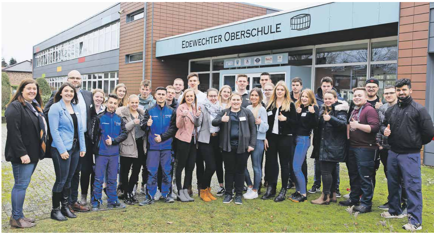
Werbung für die duale Ausbildung: Über 20 Auszubildende waren beim Start in Edewecht dabei.