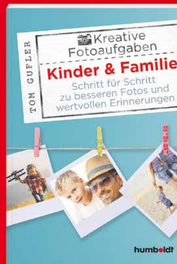
240 Seiten, Softcover ISBN 978-3-86910-093-7 € 26,99 [D] - € 27,80 [A]