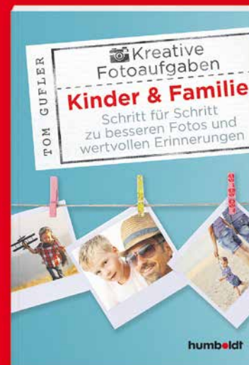
Foto- grafie entdecken.

240 Seiten, Softcover ISBN 978-3-86910-093-7 € 26,99 [D] - € 27,80 [A]