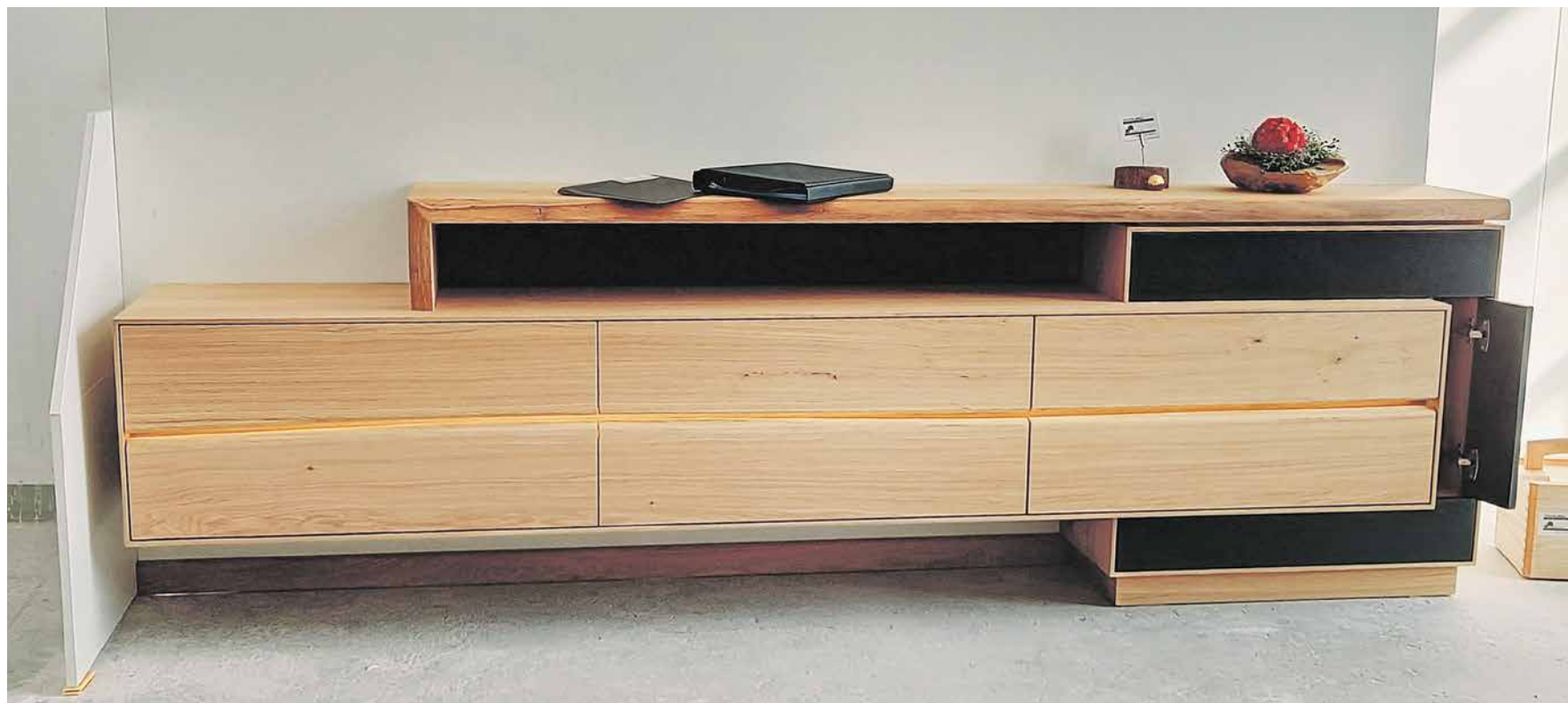
Dieses Sideboard ist eines der Meisterstücke, welches im praktischen Teil der diesjährigen Tischler-Meisterprüfung entstanden ist.