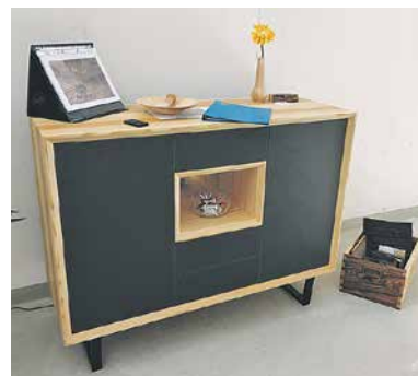
Auch diese Kommode entsprach den Bewertungskriterien.